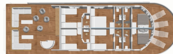
Dive deck / Salon / Restaurant