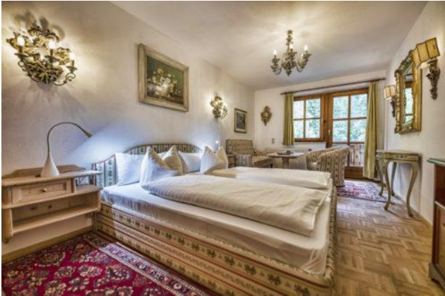
Appartement: Blumenwiese 2 Personen