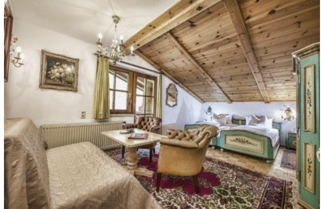
Appartement: Bachblick 3 Personen