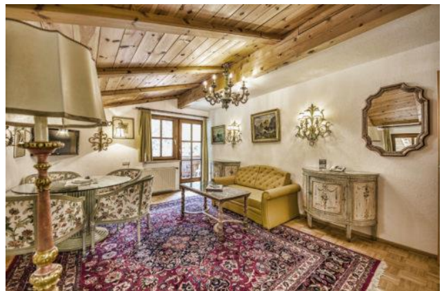
Appartement: Loreablick 5 Personen

Appartment Blumenwiese inklusive Frühstücksbüffet pro Person pro Nacht 69,00 €