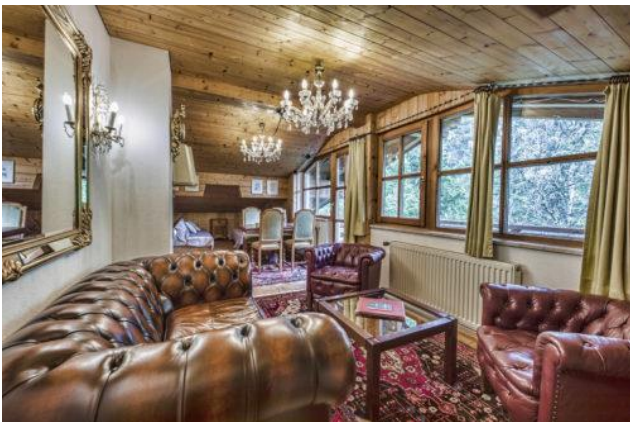
Appartement: Wanneckblick 6 Personen